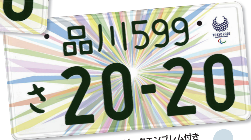
東京2020パラリンピックエンブレム付き

※オリンピックとパラリンピックを2枚1組で交付。前後面 でどちらのものを取り付けるかは自由に選択できます。