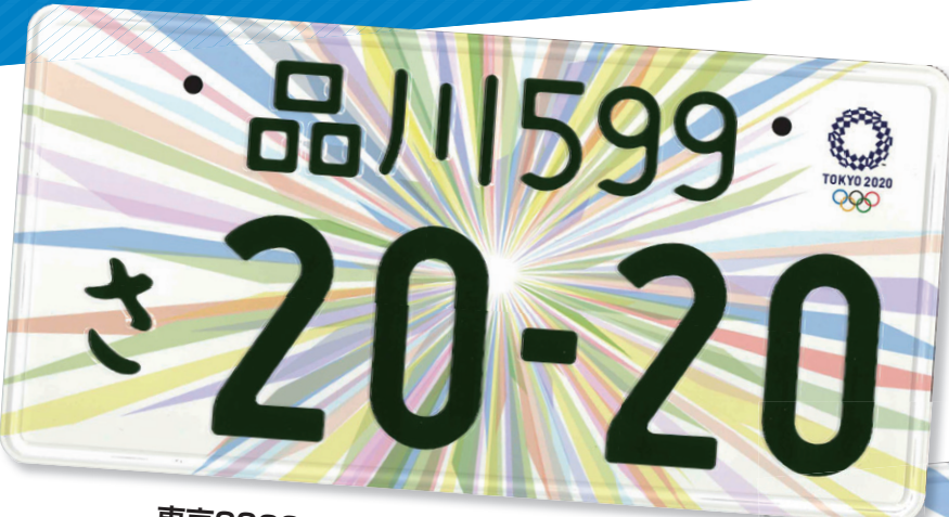
東京2020オリンピックエンブレム付き