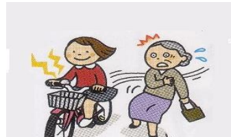
道路交通法第18条第2項