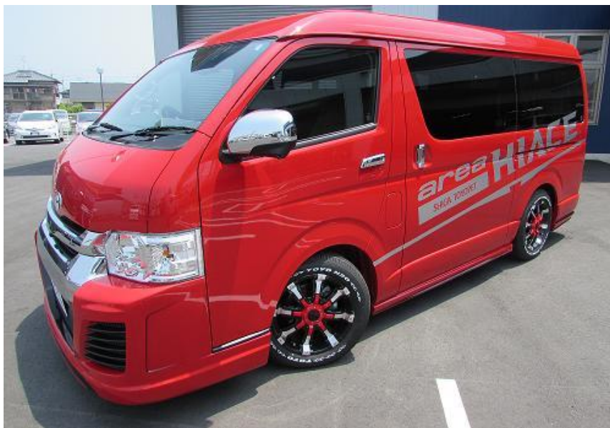
赤のエリアハイエース