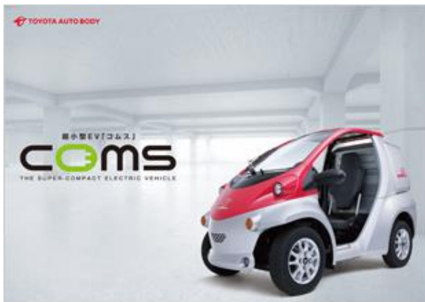
小型モビリティ車コムズ（EV）