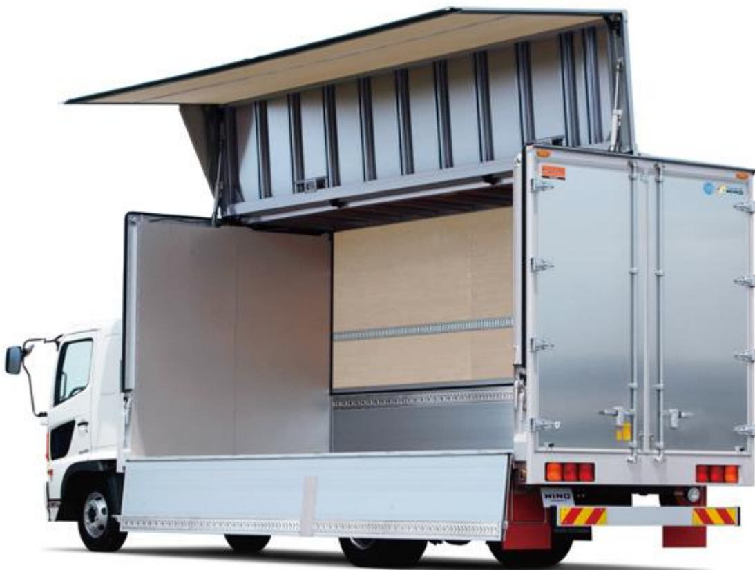
ウイング車の展示