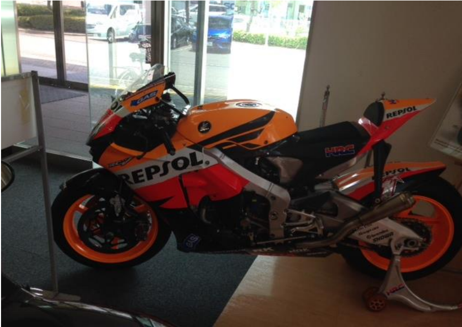
バイク レースカーNSR