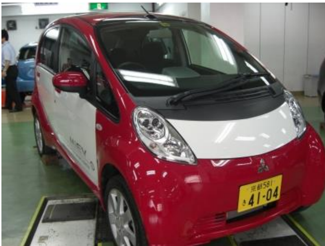
三菱 アイも展示します